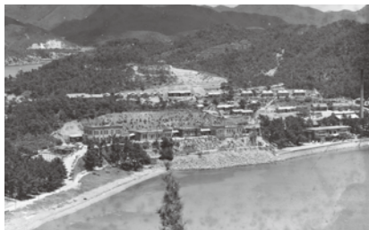
十坪住宅が並ぶ長島の風景（昭和10年代）