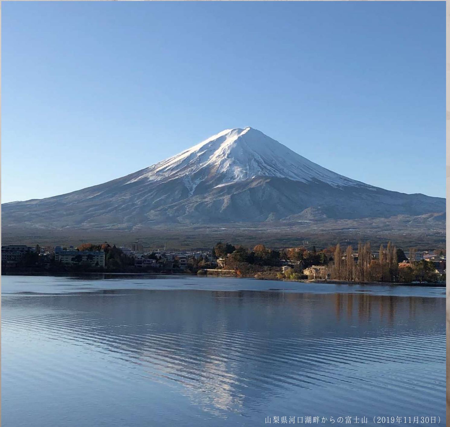
山梨県河口湖畔からの富士山（2019年11月30日）